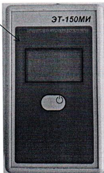
Рисунок 2.1 – Схема (рисунок) с указанием места для нанесения знака поверки на термометр

Место нанесения знака поверки при нанесении методом наклеивания