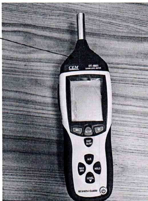
Рисунок 2.1 – Схема (рисунок) с указанием места для нанесения знака поверки