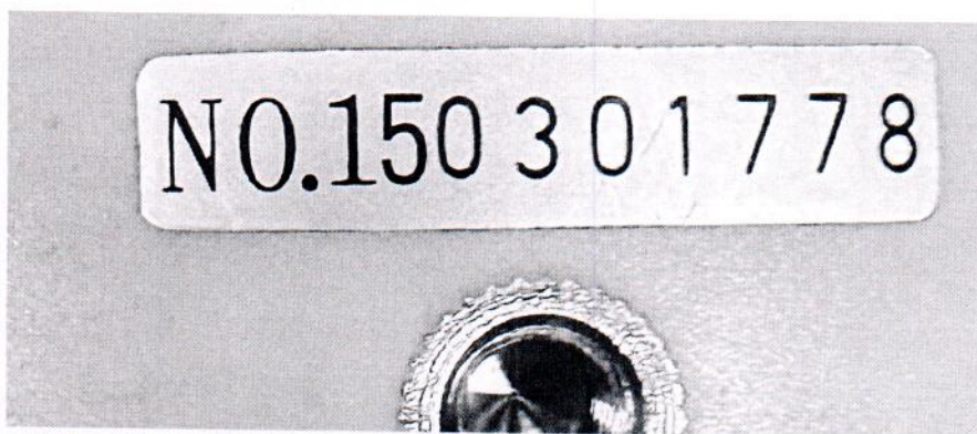
Рисунок 1.2 – Фотография маркировки измерителя уровня звука DT- 8852 № 150301778