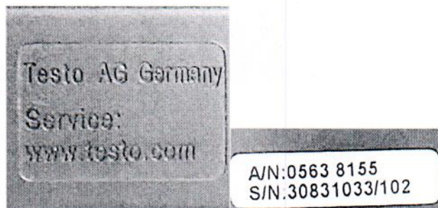
Рисунок 1.2 – Фотография маркировки измерителя уровня звука testo 815 № 30831033/102