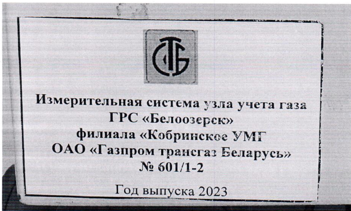
Рисунок 1.2 – Фотография маркировки ИС УУГ