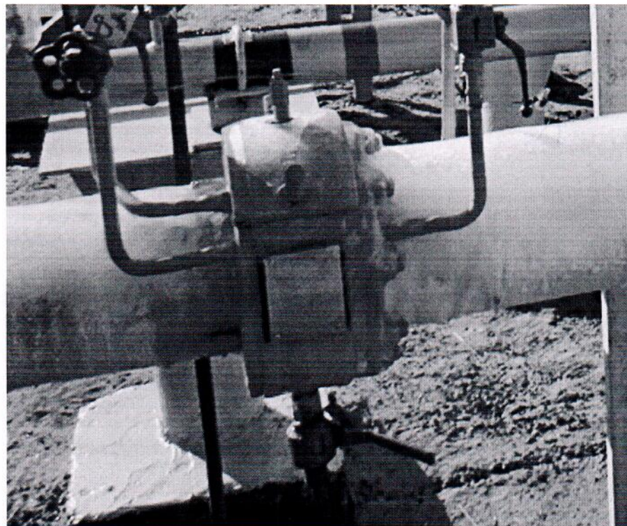
Рисунок 1.1 – Фотографии общего вида ИС УУГ