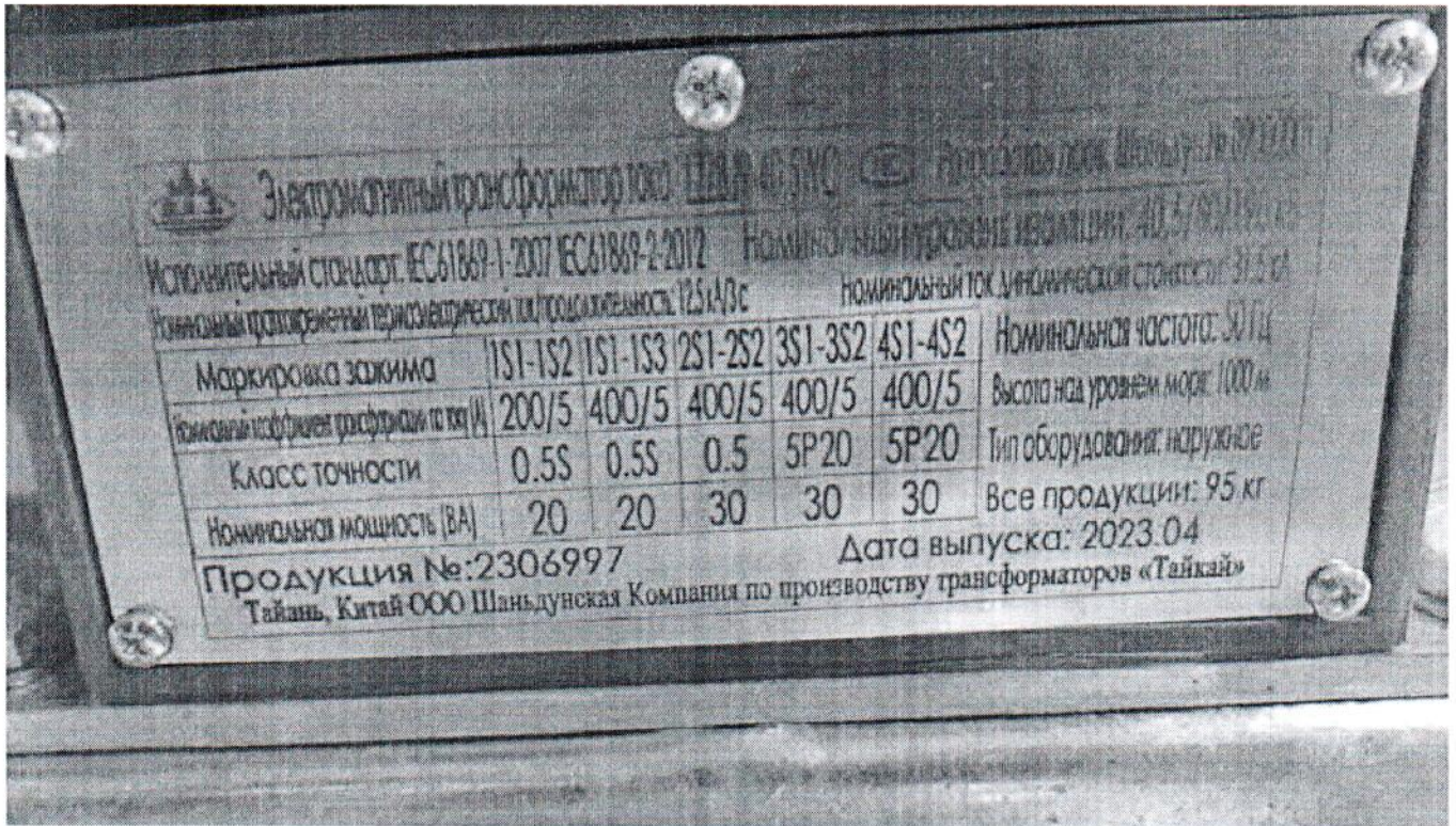
Рисунок 2 – Фотография нанесения маркировки трансформатора тока LZZBJ9-40.5WC № 2306997