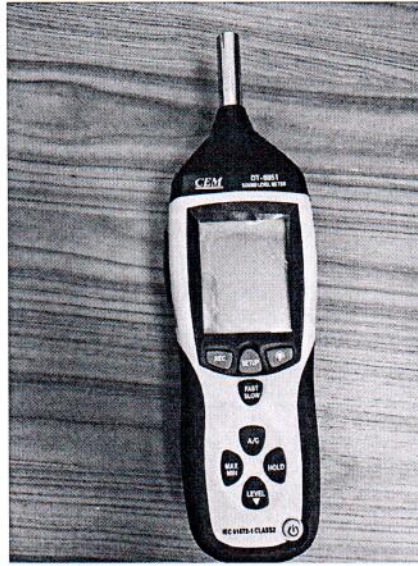
Рисунок 1.1 – Фотография общего вида измерителя уровня звука DT- 8851 № 12044609