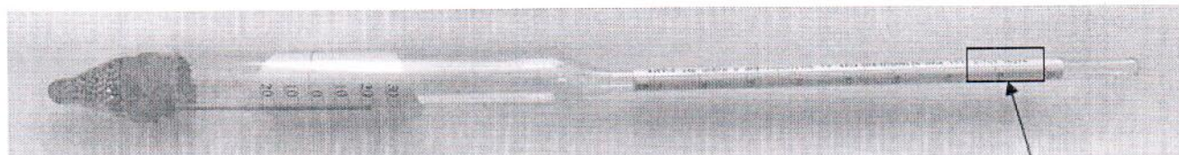
Рисунок 2 – Общий вид ареометров для нефти стеклянных АНТ-2