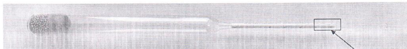
Рисунок 3 – Общий вид ареометров для нефти стеклянных АН