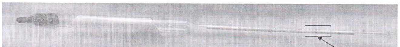
Рисунок 1 – Общий вид ареометров для нефти стеклянных АНТ-1

Общий вид ареометров и место нанесения серийного номера представлены на рисунках 1-3.