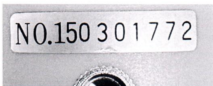
Рисунок 1.2 – Фотография маркировки измерителя уровня звука DT- 8852 № 150301772