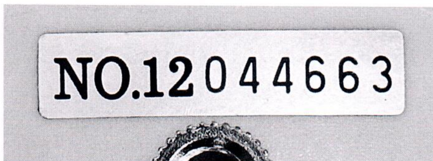
Рисунок 1.2 – Фотография маркировки измерителя уровня звука DT- 8851 № 12044663