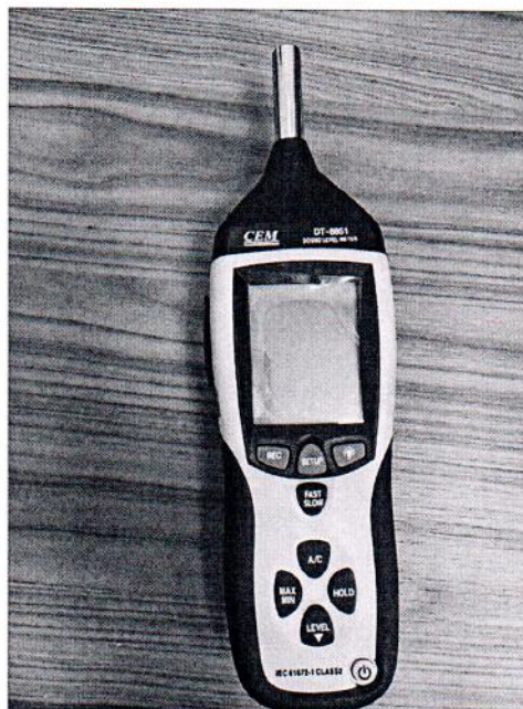
Рисунок 1.1 – Фотография общего вида измерителя уровня звука DT- 8851 № 12044663