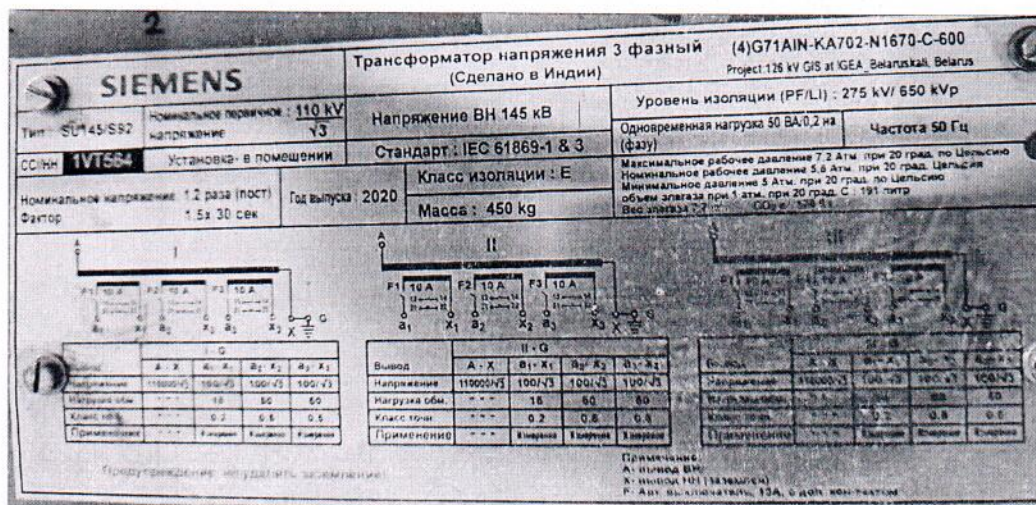
Рисунок 1.2 – Фотография маркировки трансформатора напряжения SU145/S92 № 1VT564