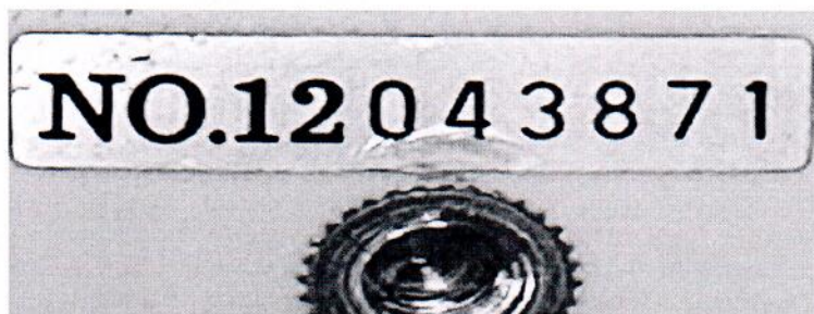
Рисунок 1.2 – Фотография маркировки измерителя уровня звука DT- 8852 № 12043871