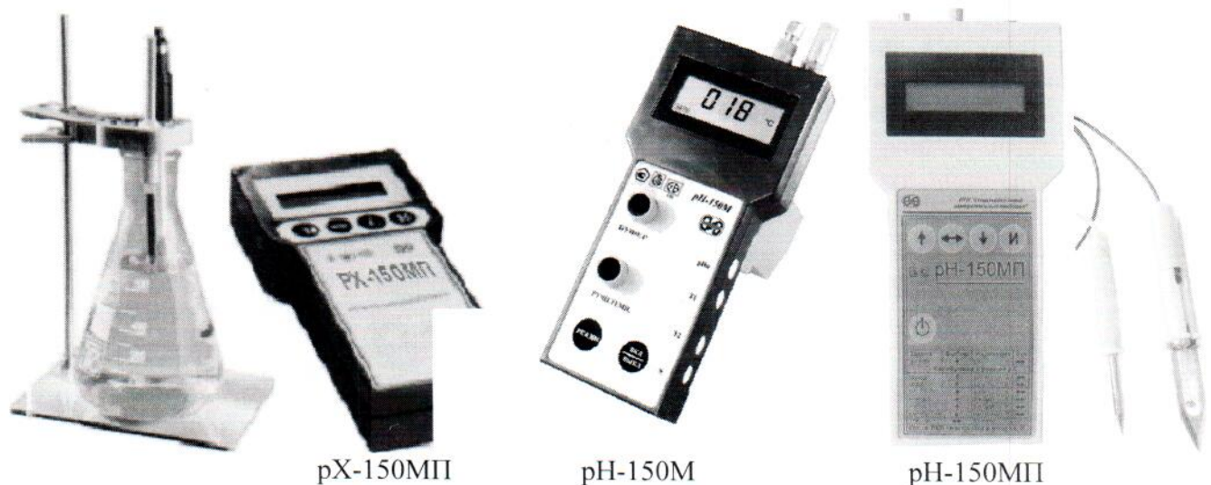
Рисунок 1 – Общий вид приборов

Схема опломбирования от несанкционированного доступа и схема нанесения на приборы знака поверки приведены в приложении А.