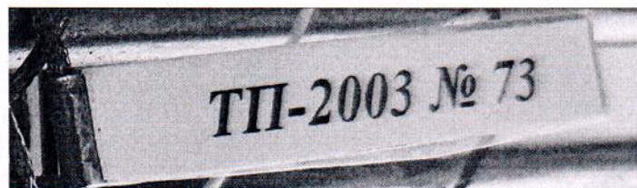
Рисунок 1.2 – Фотография маркировки приемника теплового потока охлаждаемого ТП-2003 № 73