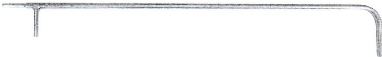
Рисунок 1 – Трубка напорная Промэкоприбор модификации Пито