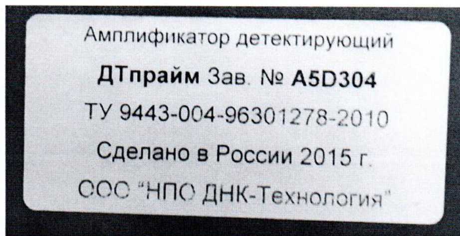
Рисунок 1.2 – Фотография маркировки амплификатора детектирующего ДТпрайм № А5D304