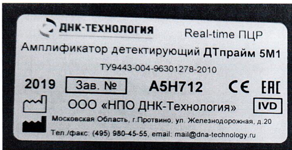
Рисунок 1.2 – Фотография маркировки амплификатора детектирующего ДТпрайм 5М1 № А5Н712