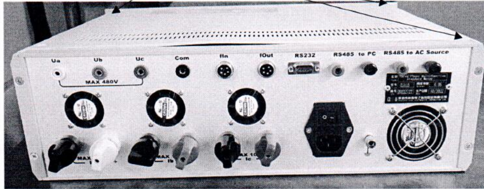
Рисунок 3.1 – Схема пломбировки от несанкционированного доступа

Место пломбировки от несанкционированного доступа