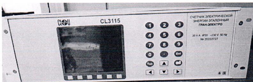
Рисунок 1.1 – Фотография общего вида счетчиков электрической энергии эталонных «ГРАН-ЭЛЕКТРО» CL3115 (изображение носит иллюстративный характер)

Фотографии общего вида средств измерений