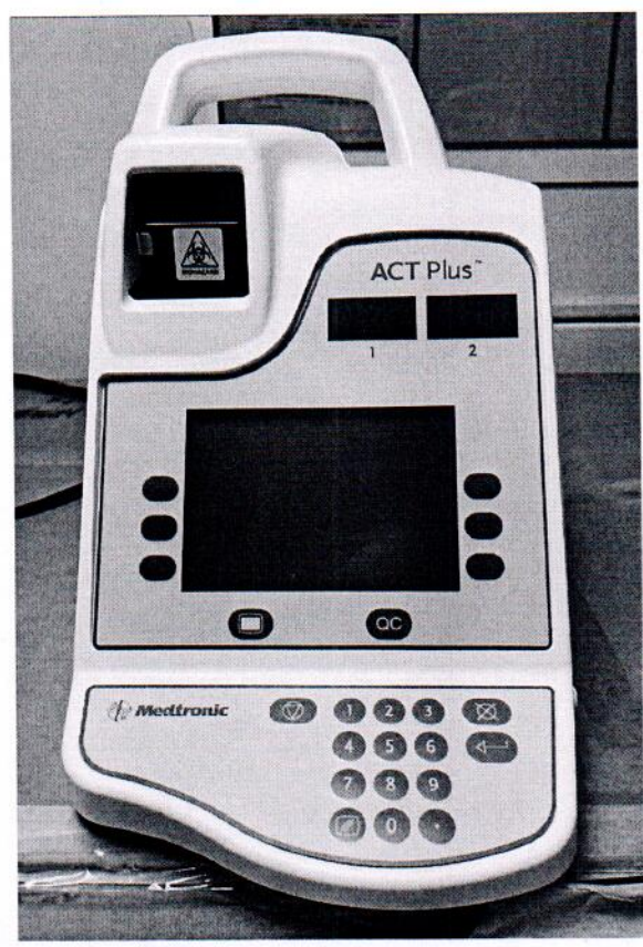
Рисунок 1.1 – Фотография общего вида автоматического таймера коагуляции ACT Plus № ACT2008288