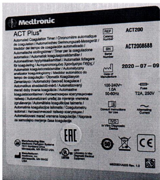
Рисунок 1.2 – Фотография маркировки автоматического таймера коагуляции ACT Plus № ACT2008688