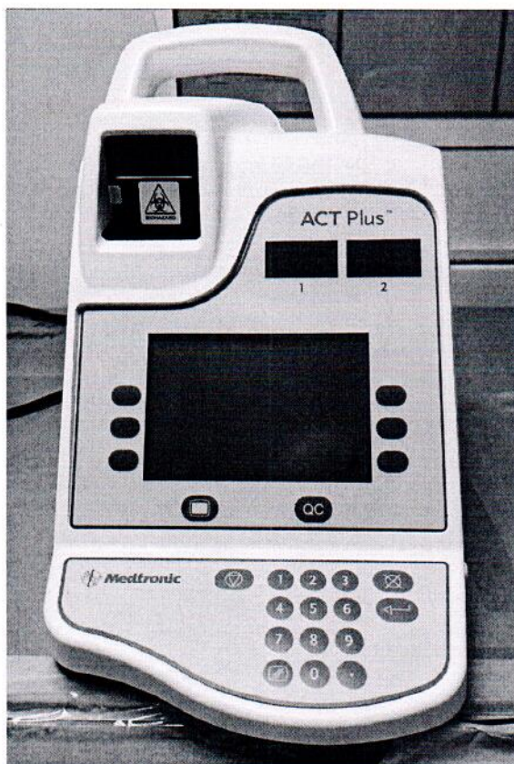
Рисунок 1.1 – Фотография общего вида автоматического таймера коагуляции ACT Plus № ACT2008688

Фотографии общего вида средств измерений