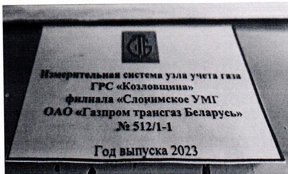
Рисунок 1.2 – Фотография маркировки ИС УУГ