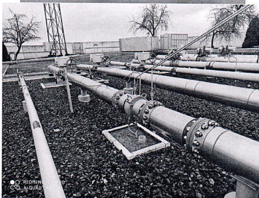
Рисунок 1.1 – Фотографии общего вида ИС УУГ