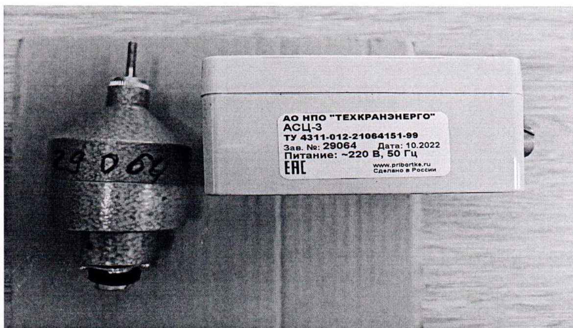
Рисунок 1.2 – Фотография маркировки анемометра сигнального цифрового АСЦ-3 № 29064