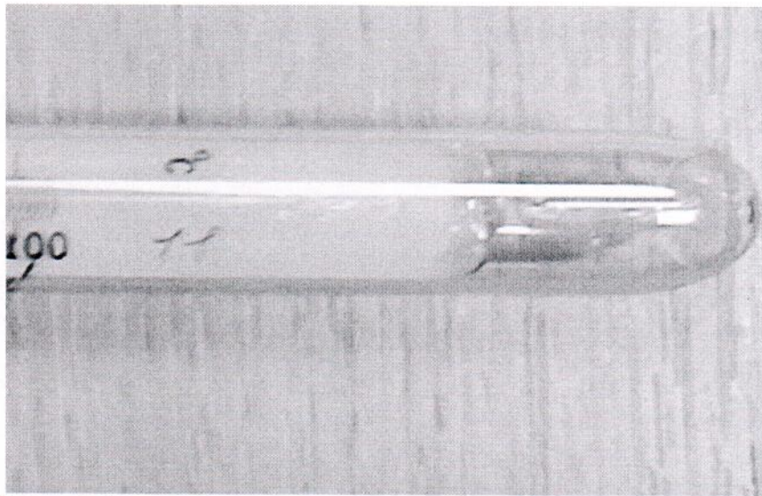
Рисунок 1.2 – Фотография маркировки термометра лабораторного стеклянного с взаимозаменяемыми конусами № 3, заводской № 11