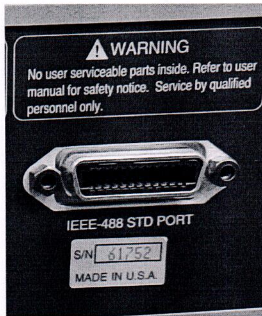
Рисунок 1.2 – Фотография маркировки генератора сигналов DS360 № 61752