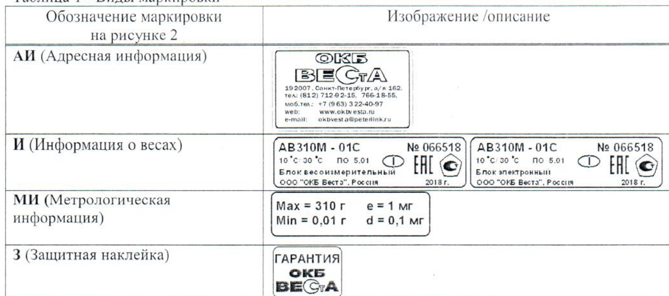
Таблица 1 - Виды маркировки

Для защиты весов от несанкционированной настройки и вмешательства, которые могут привести к искажению результатов измерений, блоки весовой и электронный пломбируются поверх винтов стяжки корпуса защитной наклейкой изготовителя (рисунок 2, обозначение наклейки «З»). При отклеивании разрушается изображение, нанесенное на наклейку. Отсутствие самой наклейки или разрушенное изображение надписей на наклейке свидетельствует об имевших место несанкционированных действиях.