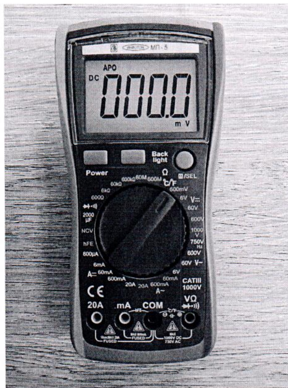
Рисунок 1.1 – Фотография общего вида мультиметра портативного МП-5 (изображение носит иллюстративный характер)

Фотографии общего вида средств измерений