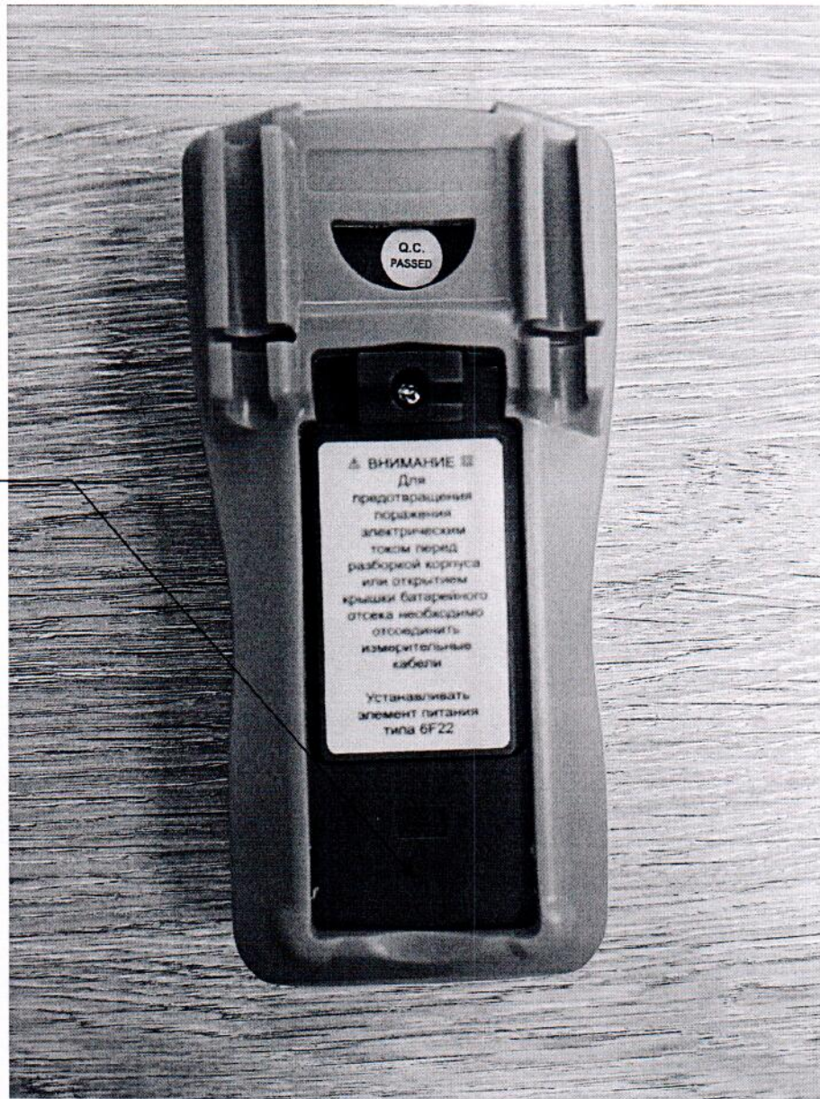
Рисунок 2.1 – Схема с указанием места для нанесения знака поверки (изображение носит иллюстративный характер)