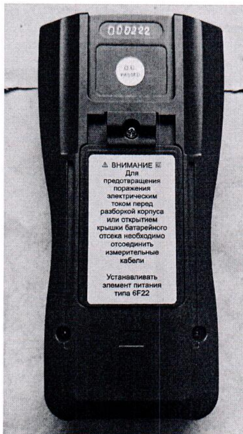
Рисунок 1.4 – Фотография маркировки мультиметра портативного МП-5/1 (изображение носит иллюстративный характер)