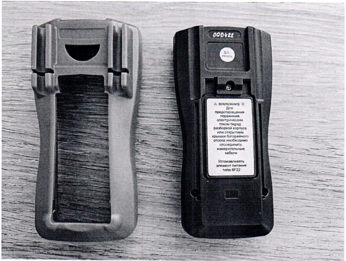
Рисунок 1.3 – Фотография маркировки мультиметра портативного МП-5 (изображение носит иллюстративный характер)