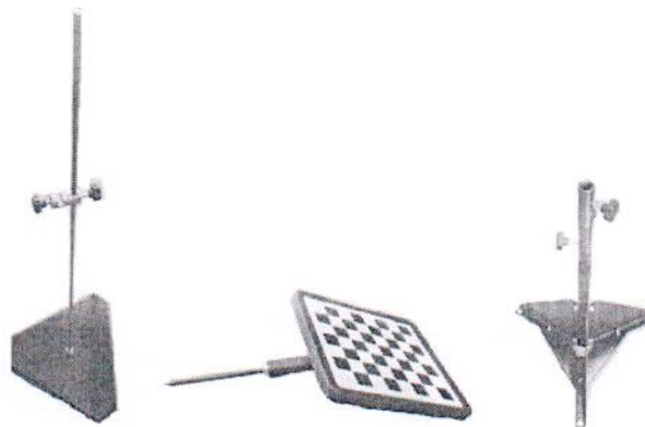
Рисунок 2 Дополнительный набор механических приспособлений