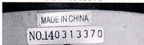
Рисунок 1.2 – Фотография маркировки измерителя уровня звука DT- 8852 № 140313370