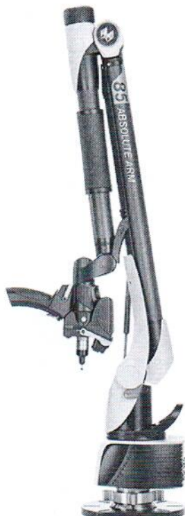
Absolute Arm 85