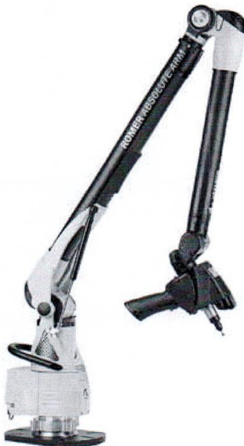
Рисунок 3 – Машины Romer Absolute Arm 7325 S/N 7325SI-5445-FA