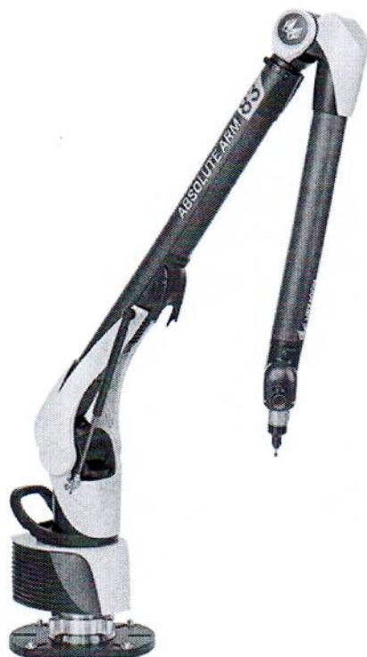
Absolute Arm 83

Место нанесения знака поверки в виде клейма-наклейки приведено в Приложении А к Описанию типа.