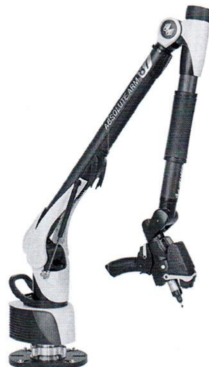
Absolute Arm 87