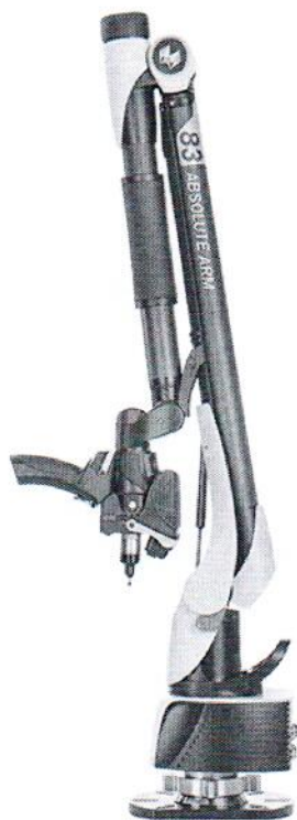
Absolute Arm 83