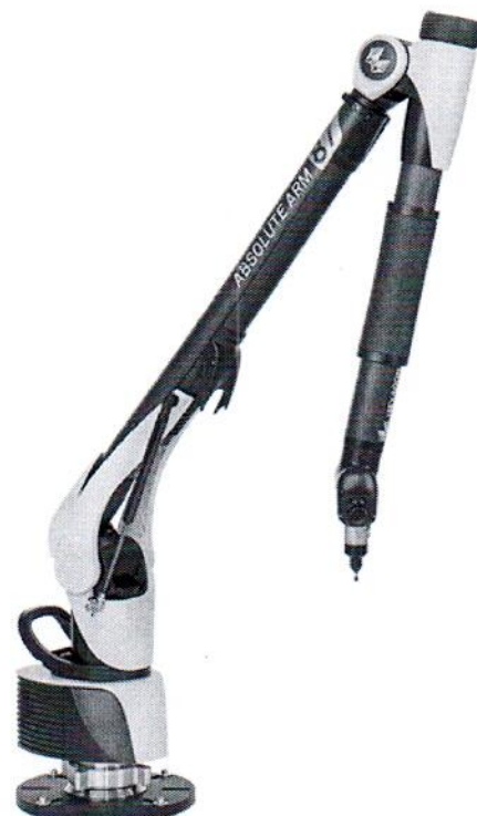
Absolute Arm 87