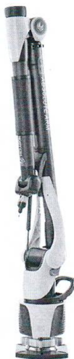
Absolute Arm 85