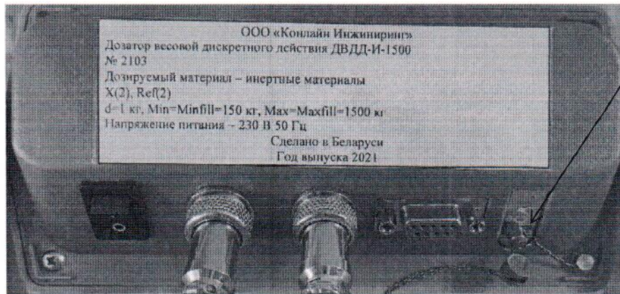
Рисунок 3.1 – Фотография с указанием места пломбировки от несанкционированного доступа в виде давления на пломбу на тыльной стороне индикатора весового CAS CI-2001A

Место пломбировки от несанкционированного доступа