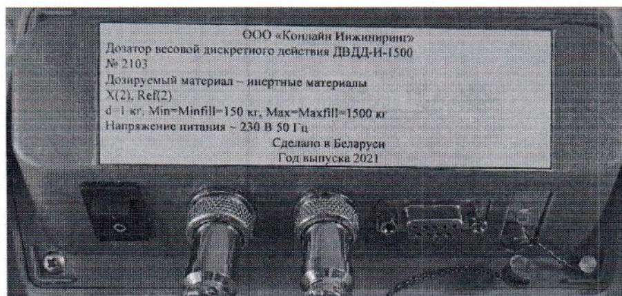
Рисунок 1.3 – Маркировка дозатора весового дискретного действия ДВДД-И-1500 № 2103