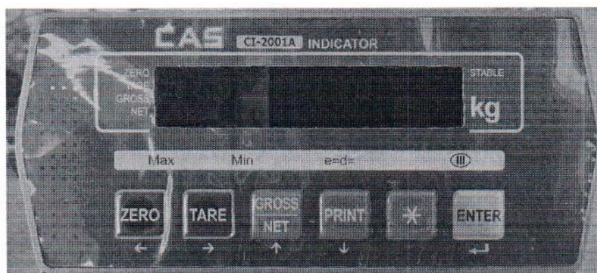
Рисунок 1.2 – Индикатор весовой CAS CI-2001A