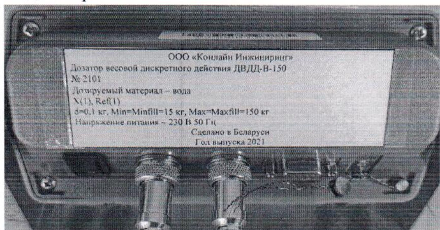
Рисунок 1.3 – Маркировка дозатора весового дискретного действия ДВДД-В-150 № 2101