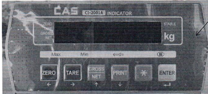
Рисунок 2.1 – Фотография с указанием места нанесения знака поверки (наклейки) на лицевую панель индикатора весового CAS CI- 2001A

Место нанесения знака поверки (наклейки)