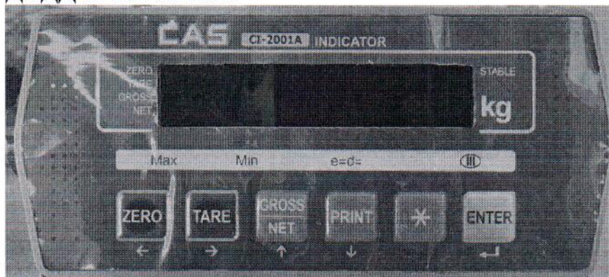
Рисунок 1.2 – Индикатор весовой CAS CI-2001A