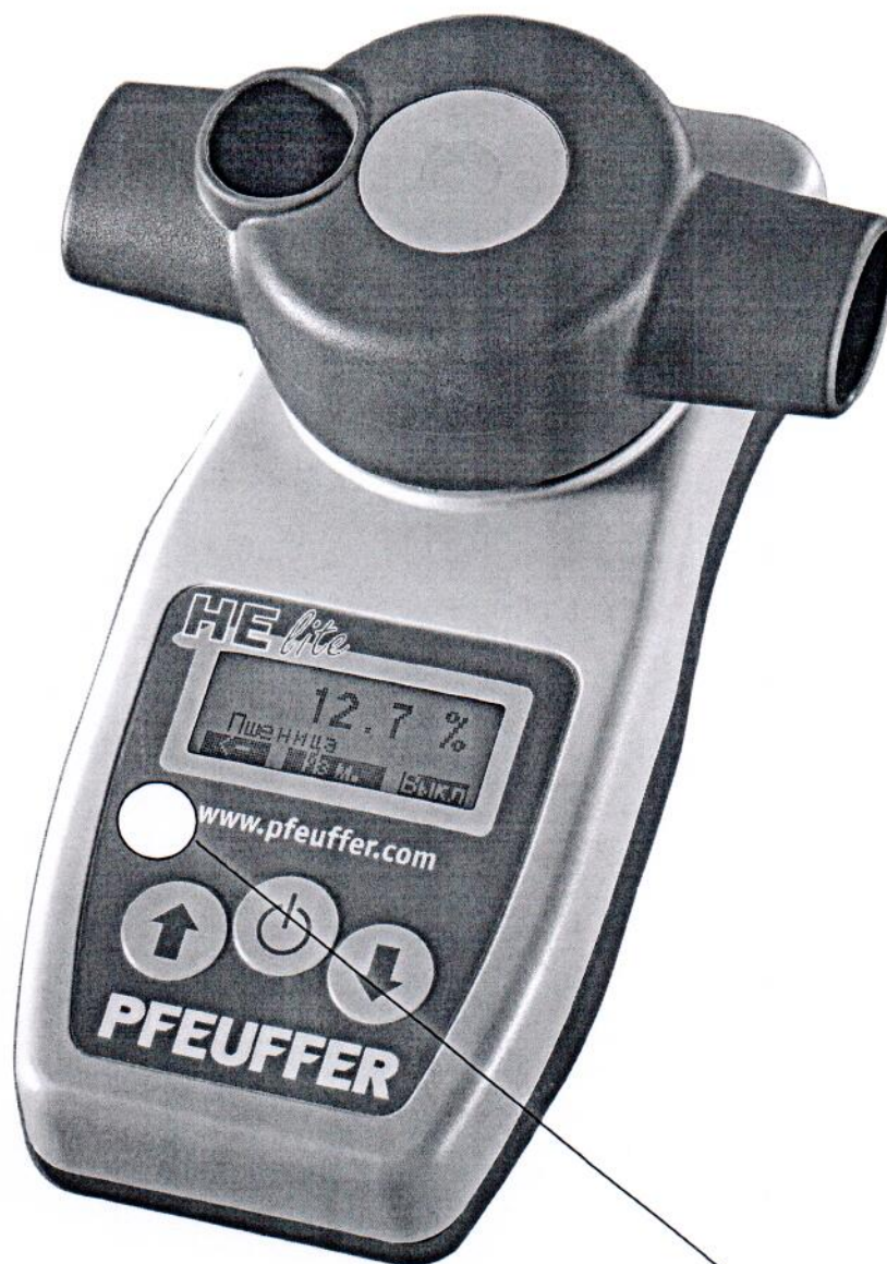
Схема с указанием места нанесения знака поверки (клейма-наклейки)

Место нанесения знака поверки (клеймо-наклейка)