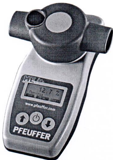
Влагомер HE lite

Внешний вид влагомеров HE 50, HE lite приведен на рисунке 1.