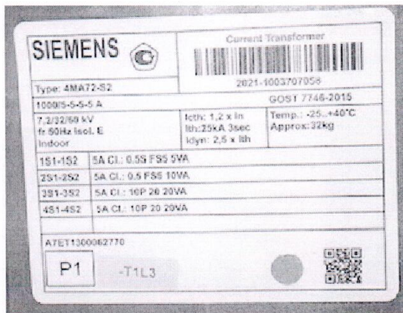
Рисунок 1.2 – Фотография маркировки трансформатора тока 4MA72-S2 АУС № 1003707058