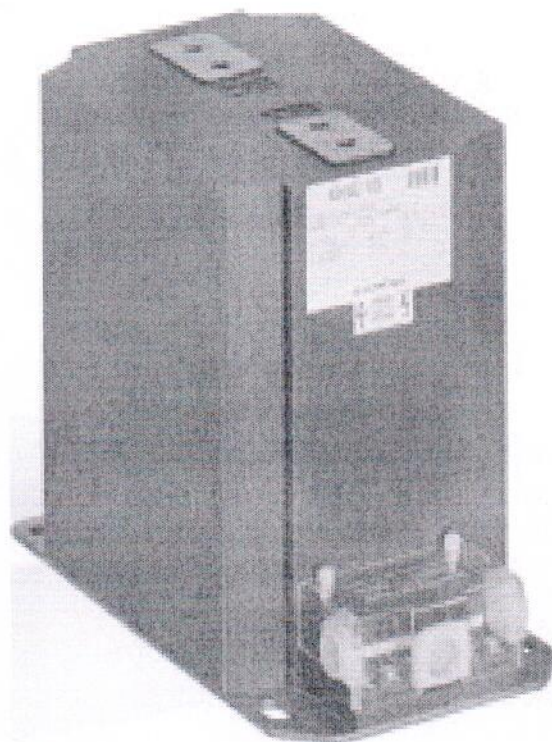
Рисунок 1.1 – Фотография общего вида трансформатора тока 4MA72-S2 АУС № 1003707058

Фотографии общего вида средства измерений