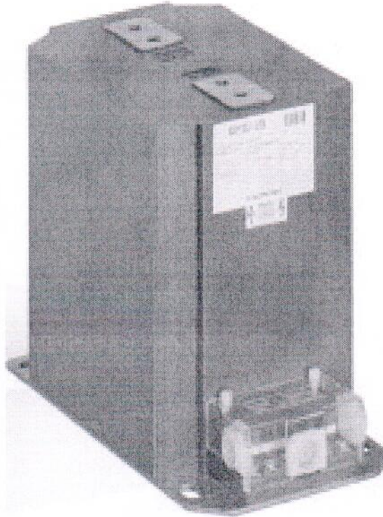
Рисунок 1.1 – Фотография общего вида трансформатора тока 4MA72-S2 АУС № 1003710850

Фотографии общего вида средства измерений