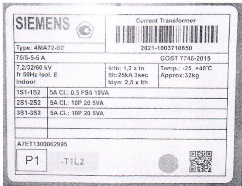
Рисунок 1.2 – Фотография маркировки трансформатора тока 4MA72-S2 АУС № 1003710850