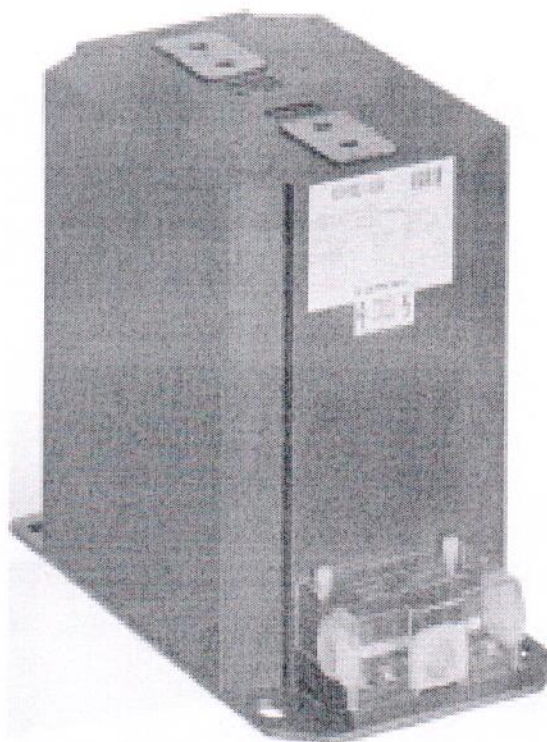
Рисунок 1.1 – Фотография общего вида трансформатора тока 4MA72-S2 АУС № 1003710851

Фотографии общего вида средства измерений