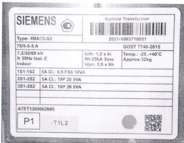
Рисунок 1.2 – Фотография маркировки трансформатора тока 4MA72-S2 АУС № 1003710851