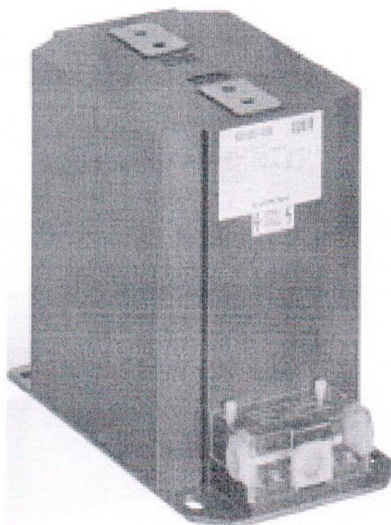
Рисунок 1.1 – Фотография общего вида трансформатора тока 4MA72-S2 АУС № 1003710852

Фотографии общего вида средства измерений