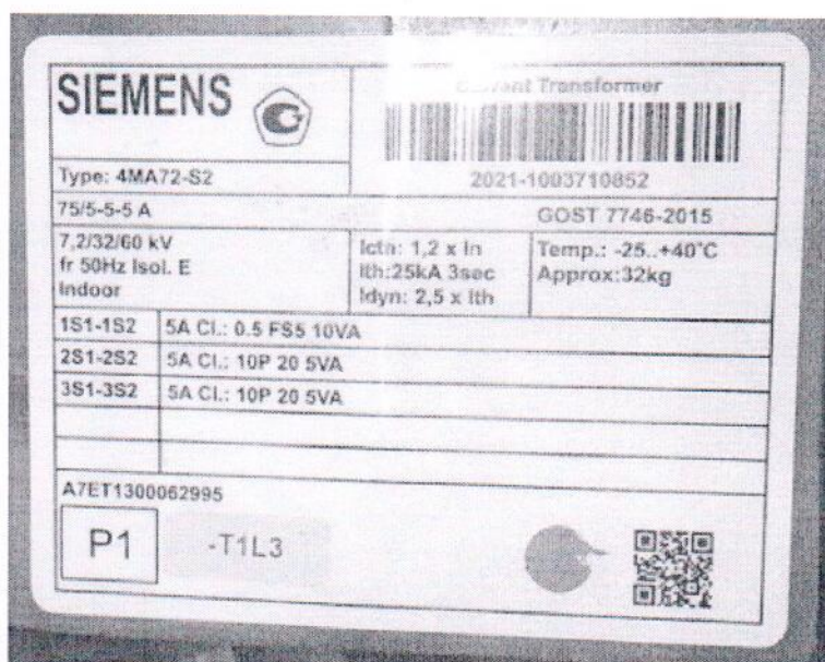
Рисунок 1.2 – Фотография маркировки трансформатора тока 4MA72-S2 АУС № 1003710852