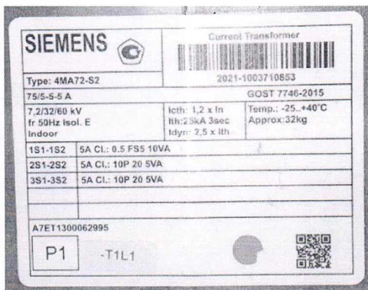
Рисунок 1.2 – Фотография маркировки трансформатора тока 4MA72-S2 АУС № 1003710853