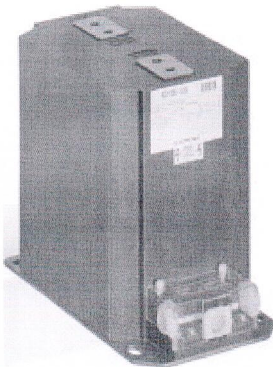
Рисунок 1.1 – Фотография общего вида трансформатора тока 4MA72-S2 АУС № 1003710853

Фотографии общего вида средства измерений