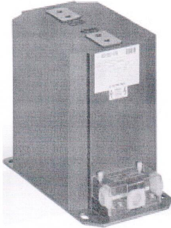
Рисунок 1.1 – Фотография общего вида трансформатора тока 4MA72-S2 АУС № 1003710855

Фотографии общего вида средства измерений