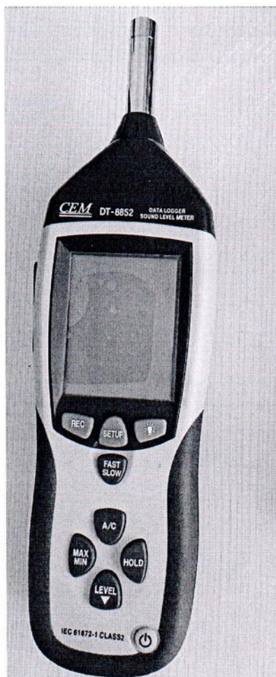
Рисунок 1.1 – Фотография общего вида измерителя уровня звука DT- 8852 № 150816206