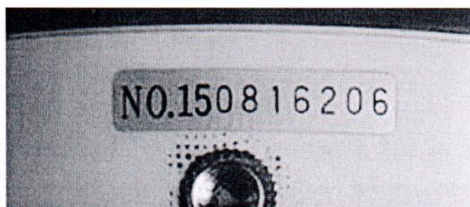
Рисунок 1.2 – Фотография маркировки измерителя уровня звука DT- 8852 № 150816206