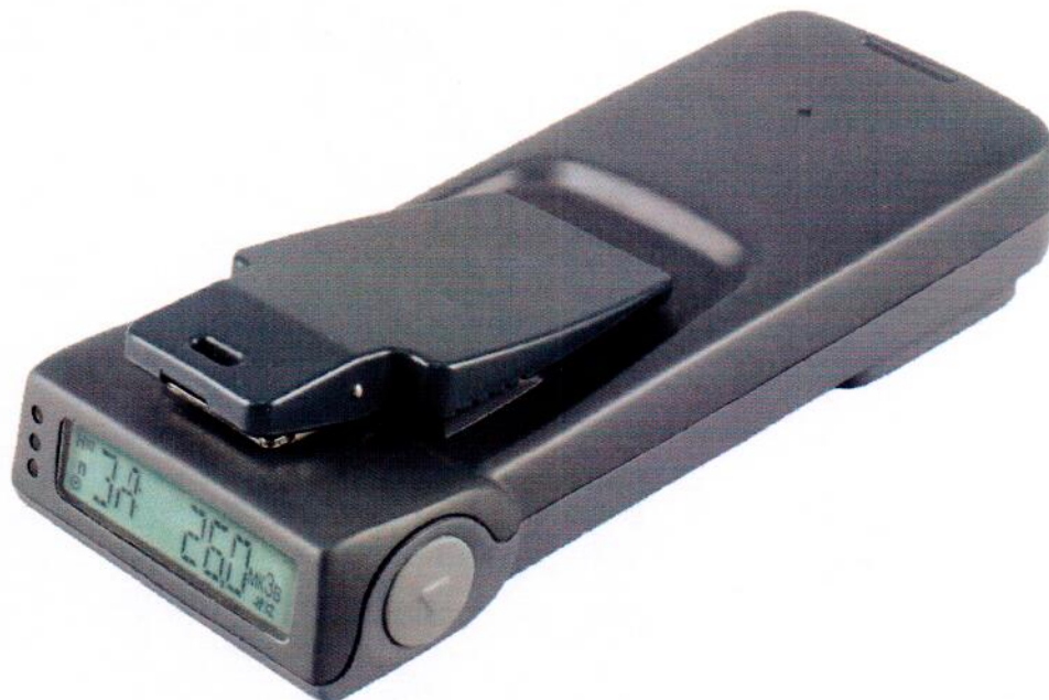
Рисунок 1.2 – Фотография общего вида дозиметров модификаций ДКГ-PM1300ГН, ДКГ-PM1300ГН-01 (изображение носит иллюстративный характер)