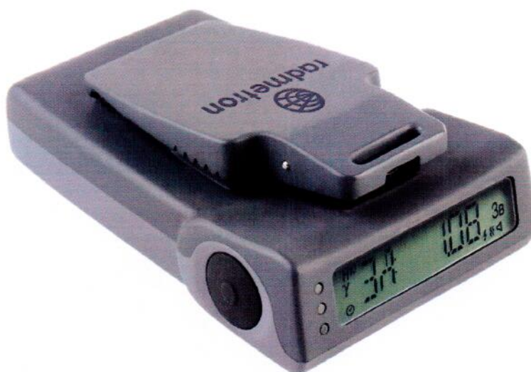
Рисунок 1.1 – Фотография общего вида дозиметров модификаций ДКГ-PM1300, ДКГ-PM1300-01 (изображение носит иллюстративный характер)