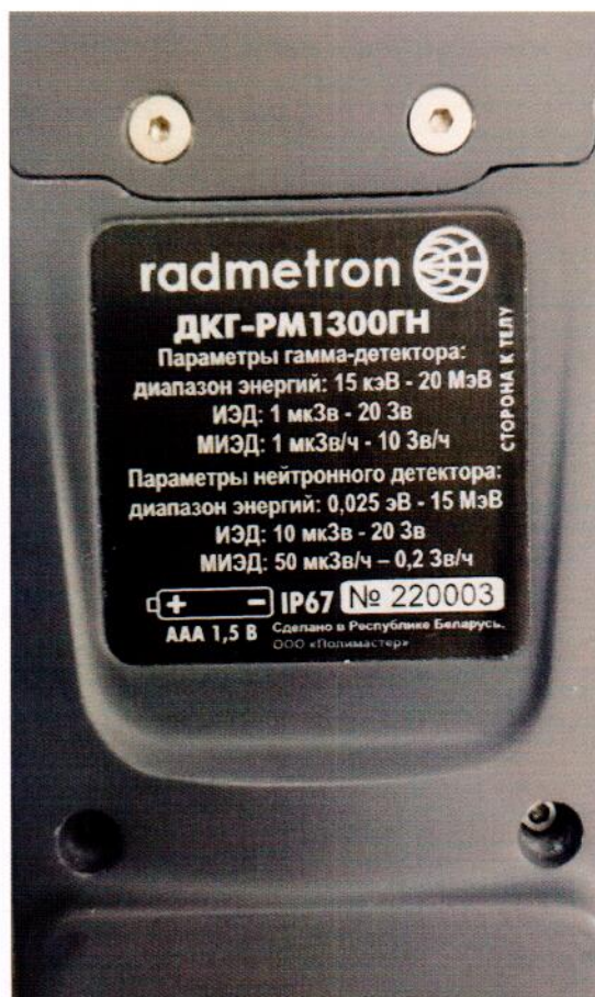
Рисунок 1.3 – Фотографии маркировки дозиметров (изображения носят иллюстративный характер, дата изготовления указывается в паспорте в разделе «Свидетельство о приемке»)