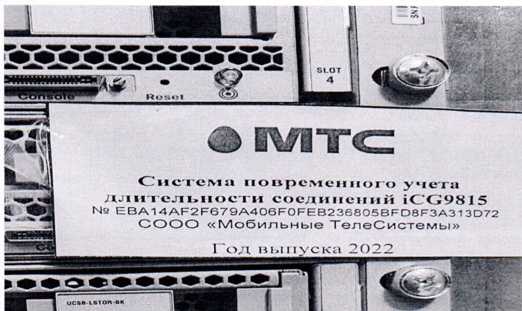
Рисунок 1.2 – Фотография маркировки системы iCG9815