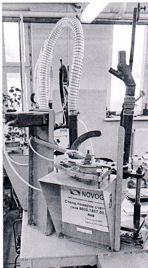
Рисунок 1.1 – Фотографии общего вида стенда поверки счетчиков газа 9000.1867.00.00 № 8