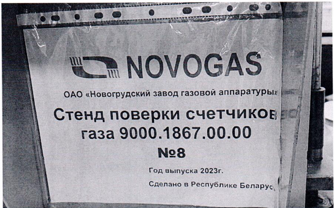
Рисунок 1.2 – Фотография маркировки стенда поверки счетчиков газа 9000.1867.00.00 № 8