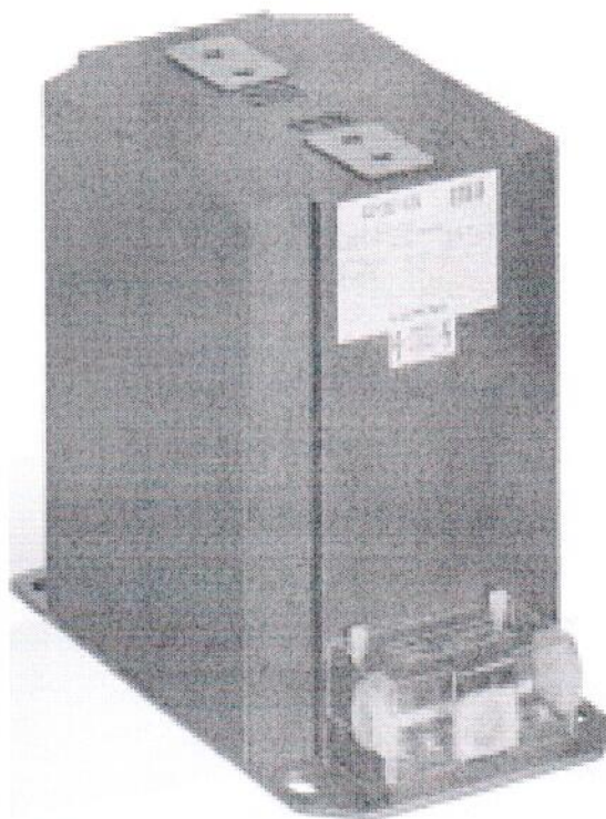
Рисунок 1.1 – Фотография общего вида трансформатора тока 4MA72-S2 АУС № 1003707026

Фотографии общего вида средства измерений