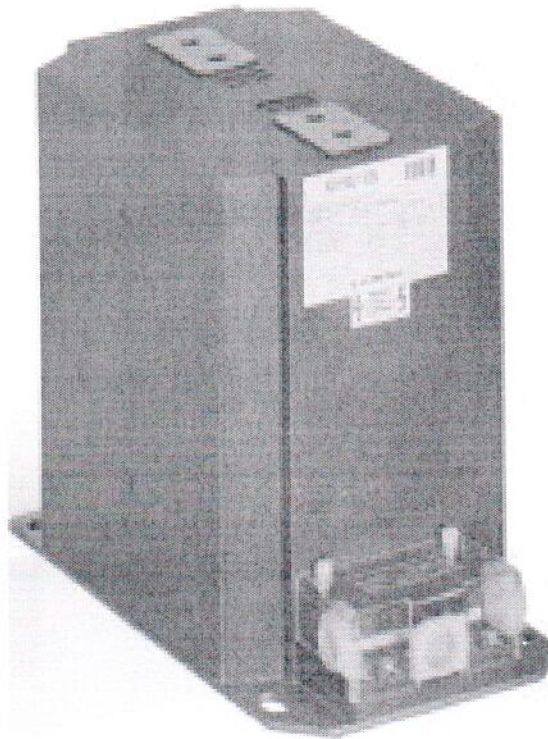
Рисунок 1.1 – Фотография общего вида трансформатора тока 4MA72-S2 АУС № 1003707041

Фотографии общего вида средства измерений