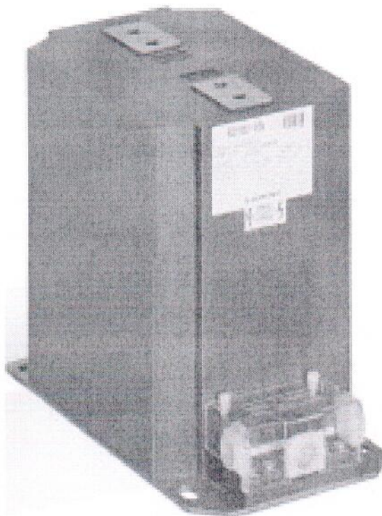
Рисунок 1.1 – Фотография общего вида трансформатора тока 4MA72-S2 АУС № 1003707050

Фотографии общего вида средства измерений