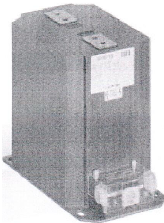
Рисунок 1.1 – Фотография общего вида трансформатора тока 4MA72-S2 АУС № 1003707051

Фотографии общего вида средства измерений