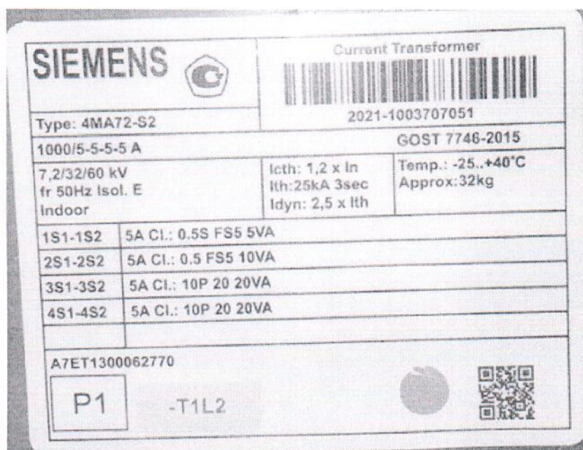
Рисунок 1.2 – Фотография маркировки трансформатора тока 4MA72-S2 АУС № 1003707051