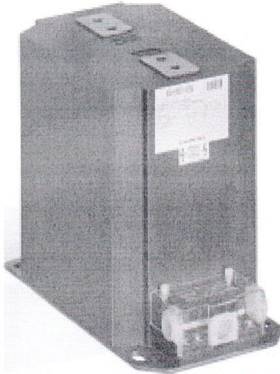
Рисунок 1.1 – Фотография общего вида трансформатора тока 4MA72-S2 АУС № 1003707053

Фотографии общего вида средства измерений