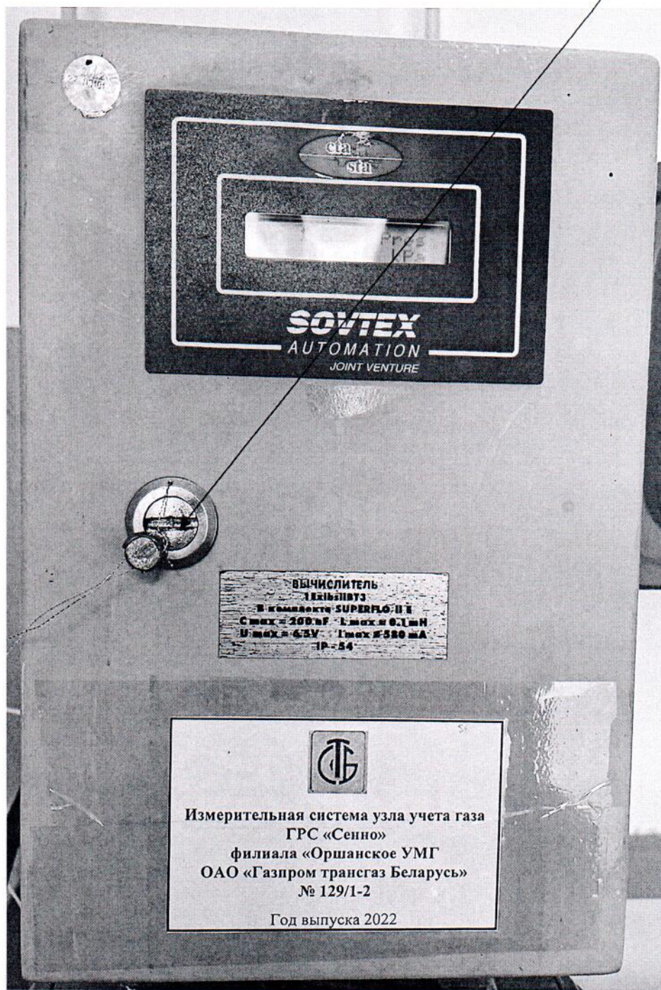
Рисунок 3.1 – Схема пломбировки от несанкционированного доступа

Место пломбировки от несанкционированного доступа