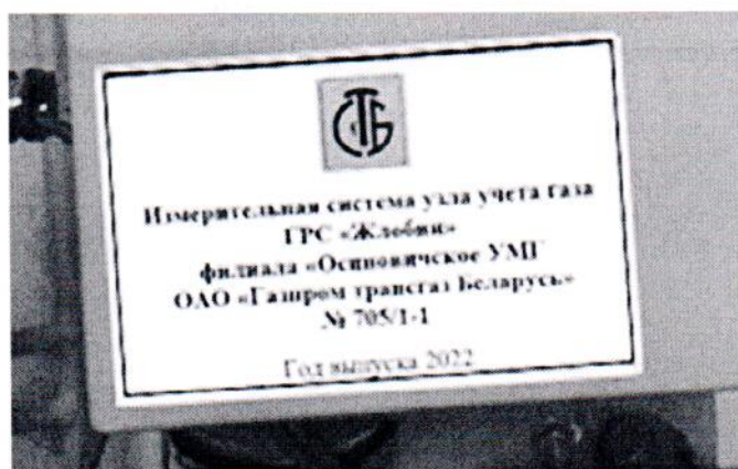
Рисунок 1.2 – Фотография маркировки ИС УУГ