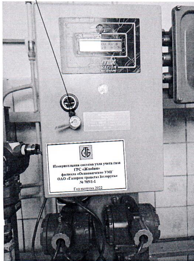
Рисунок 3.1 – Схема пломбировки от несанкционированного доступа

Схема пломбировки от несанкционированного доступа