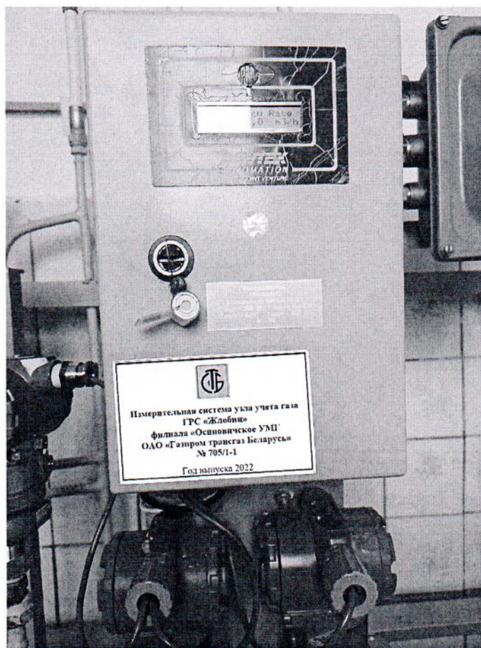
Рисунок 1.1 – Фотографии общего вида ИС УУГ